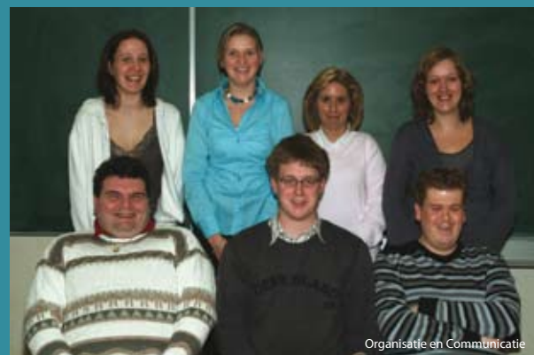
Organisatie en Communicatie

Gecombineerd onderwijs is een combinatie van contactonderwijs en afstandsonderwijs, waarbij het contactonderwijs ten minste de helft van de lestijden bedraagt. Dit schooljaar is CVO DTL gestart met de invoering ervan. Momenteel worden de modules "Photoshop3" en "Organisatie en Communicatie" in dit type onderwijs aangeboden.